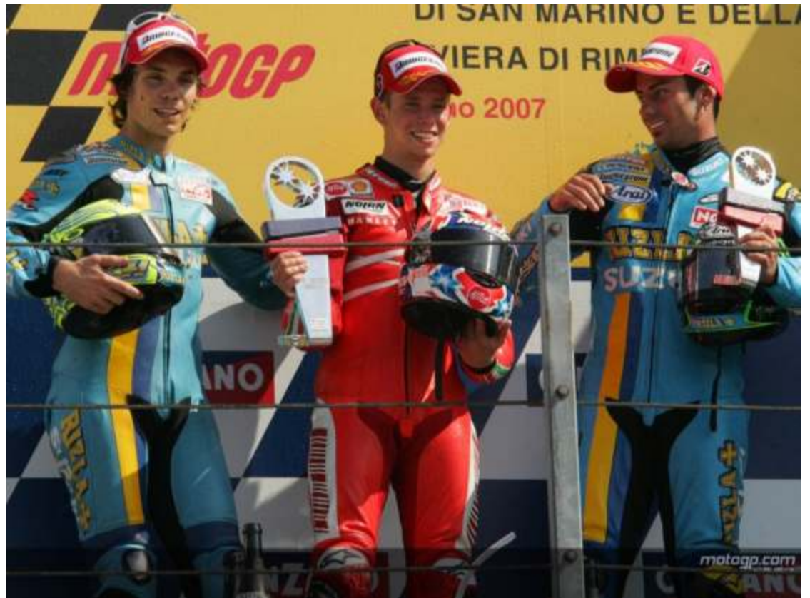
De iz. a dcha.: Chris Vermeulen, Casey Stoner, que ha dado un paso importante en la consecución del título, y John Hopkins

Marco Melandri, tras una sucesión de caídas e incidentes en las últimas carreras, finalizó en cuarta posición por delante de Loris Capirossi y los españoles Carlos Checa y Toni Elías.