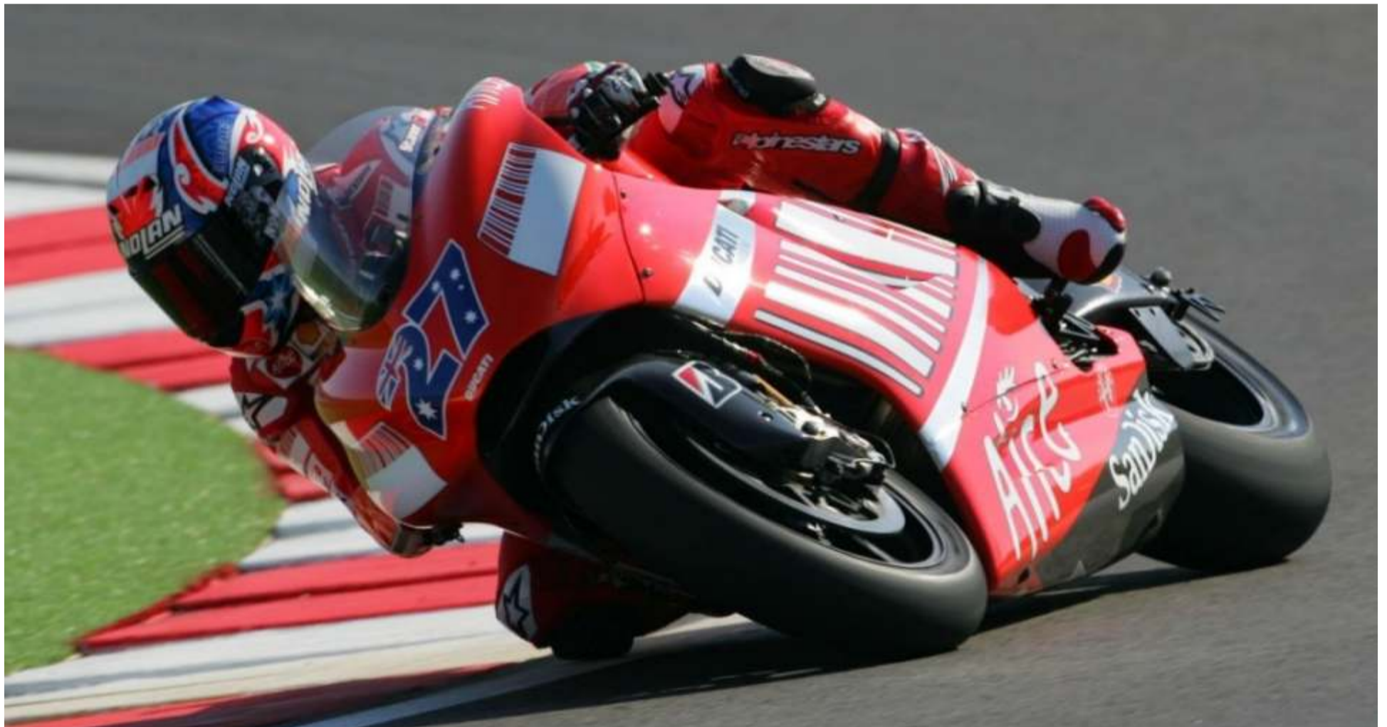
Cassey Stoner, además de conseguir la pole en un circuito que desconocía, dominó la carrera de principio a fin