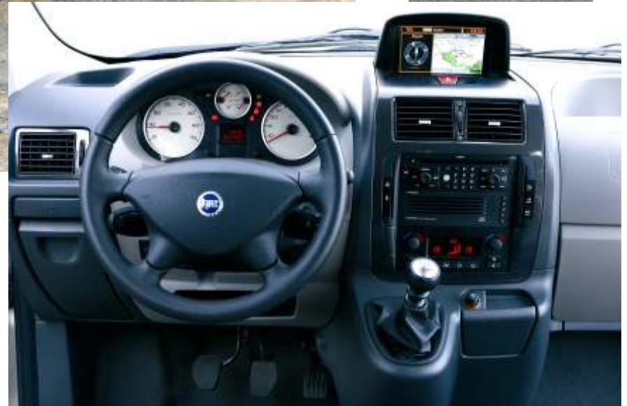
El Fiat Scudo es un vehículo comercial dotado de los últimos avances tecnológicos para facilitar el trabajo sin perder de vista la eficacia y la seguridad.