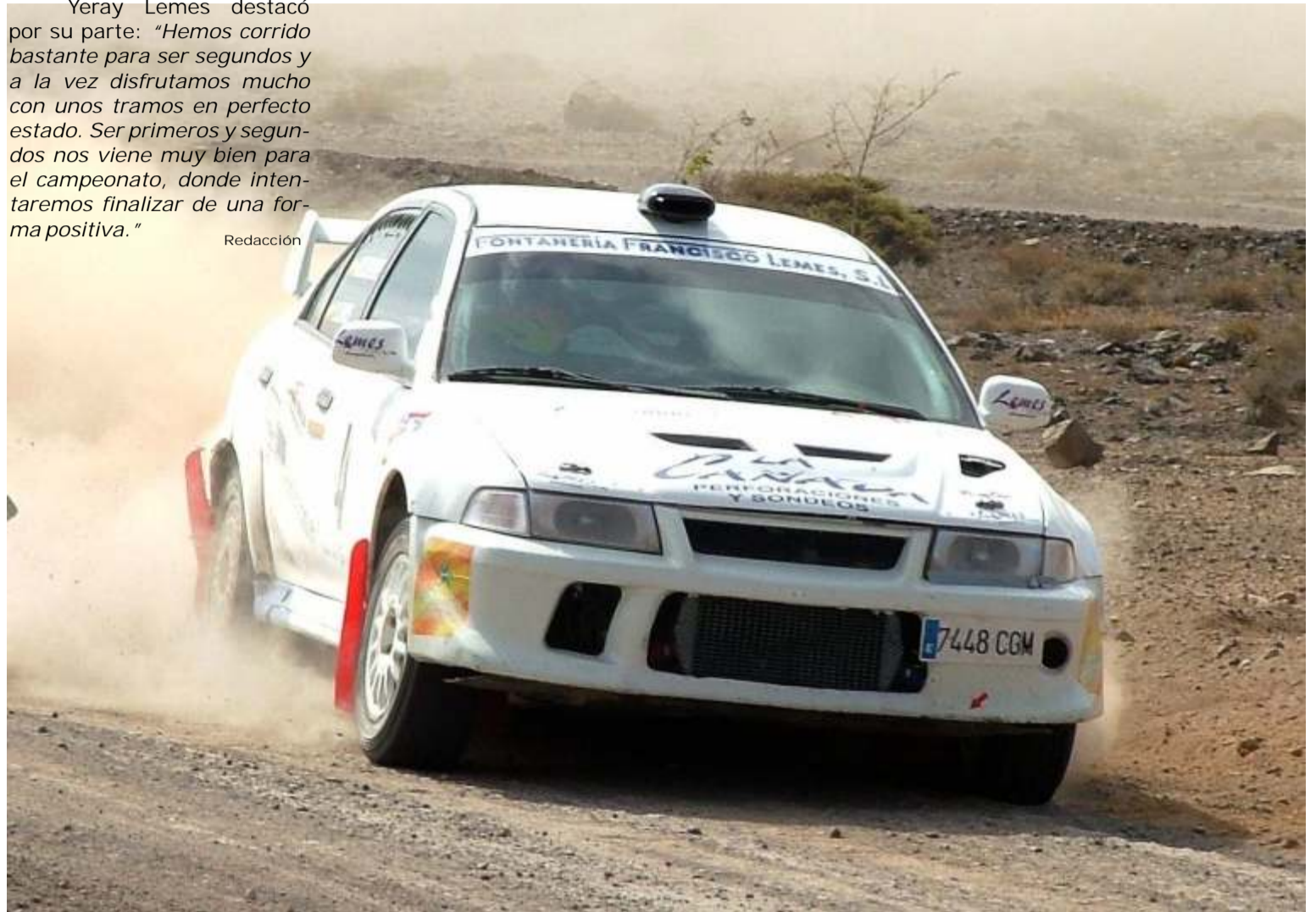
Segundos clasificados: Yeray Lemes - Rogelio Peñate