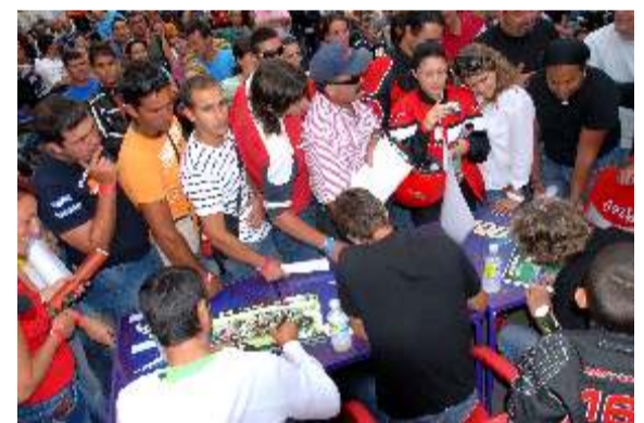
La masiva afluencia a la firma de autógrafos