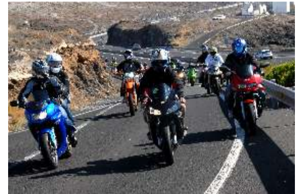
La foto no da una idea de la magnitud del evento