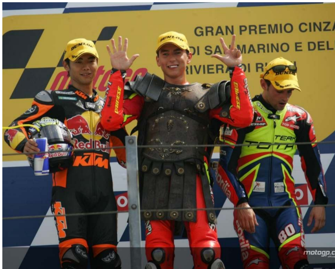
*El César* Lorenzo que domina la categoría sin paliativos y con mucha autoridad

A falta de cinco carreras para el final del campeonato Jorge Lorenzo aventaja en 54 puntos a De Angelis, que tras esta carrera se coloca segundo de la general, mientras que Dovizioso que es tercero en la provisional, ha acabado en San Marino con la racha de las 31 carreras seguidas puntuando.