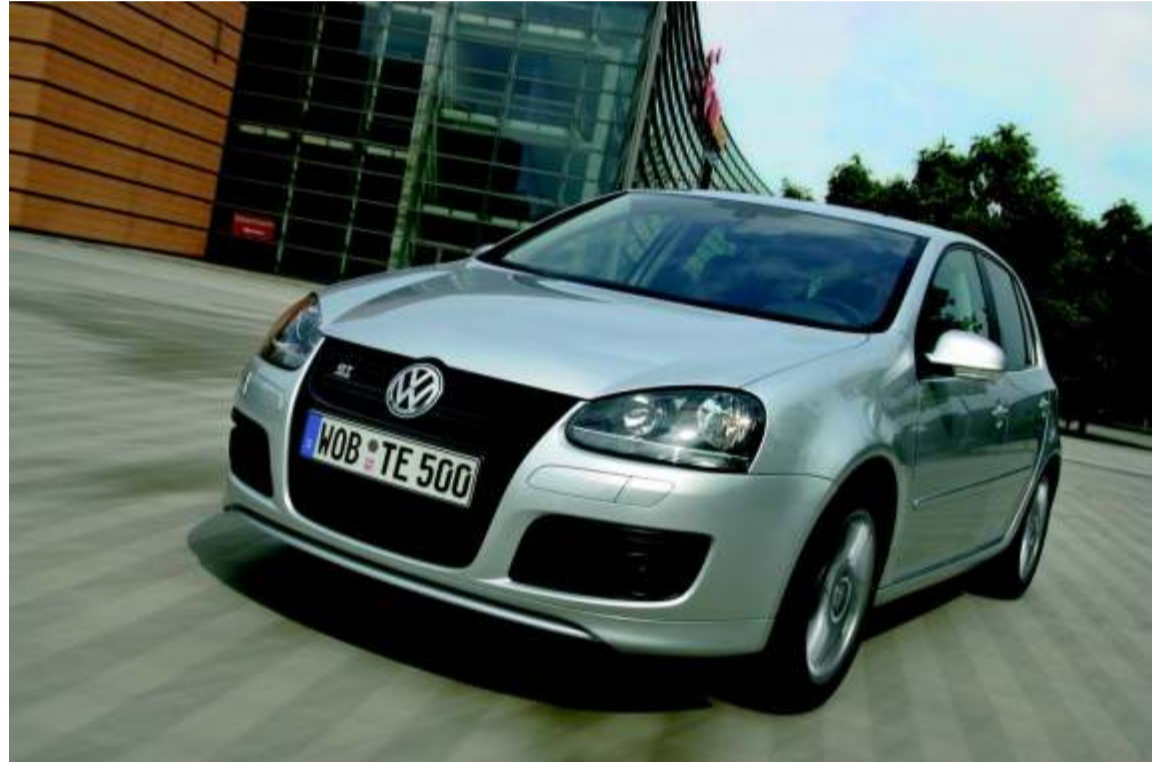
El nuevo modelo tiene suficientes argumentos para ser un coche muy interesante