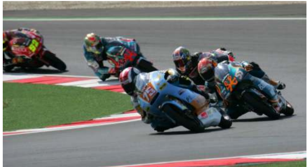
Passini que supo manejar la carrera y marcharse dejando a sus perseguidores sin argumentos