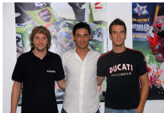
Los tres campeones posan para la posteridad