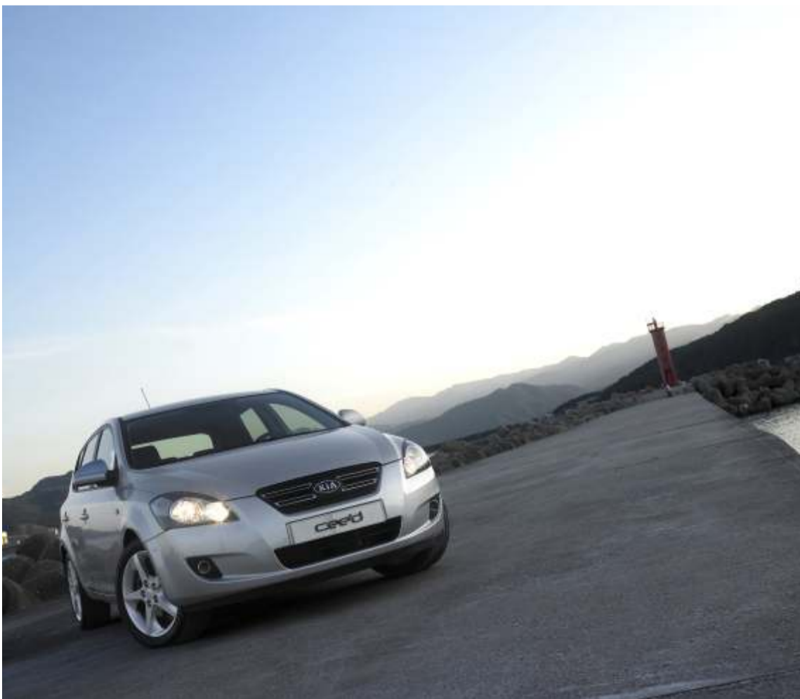
Imagen del Kia Cee´d que acaba de conseguir la máxima calificación en materia de seguridad

Los últimos resultados posicionan al cee'd como uno de los vehículos más seguros del segmento C.