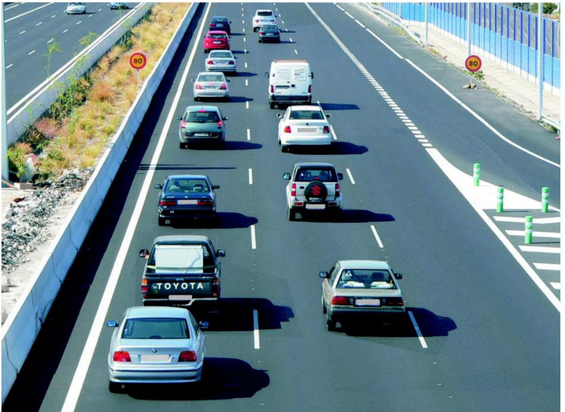
Esta es una imagen que todos hemos visto. En canarias, ¿Por qué es tan complicado circular por la derecha?