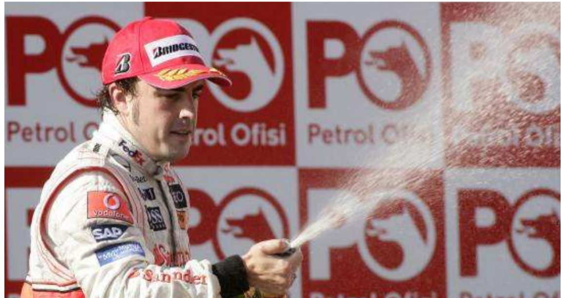
Fernando luchó y, al final, se encontró con un tercer puesto que sabe a mucho más