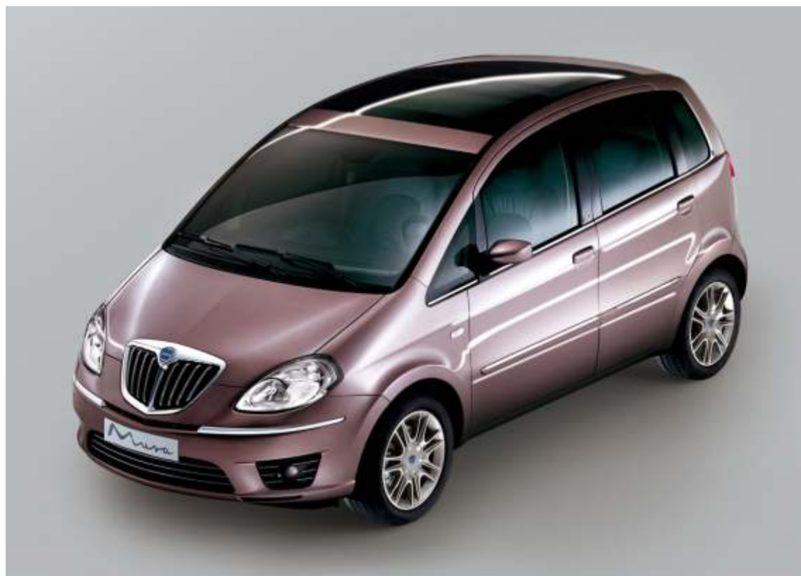
Calidad, personalidad y elegancia son características del nuevo Lancia MUSA