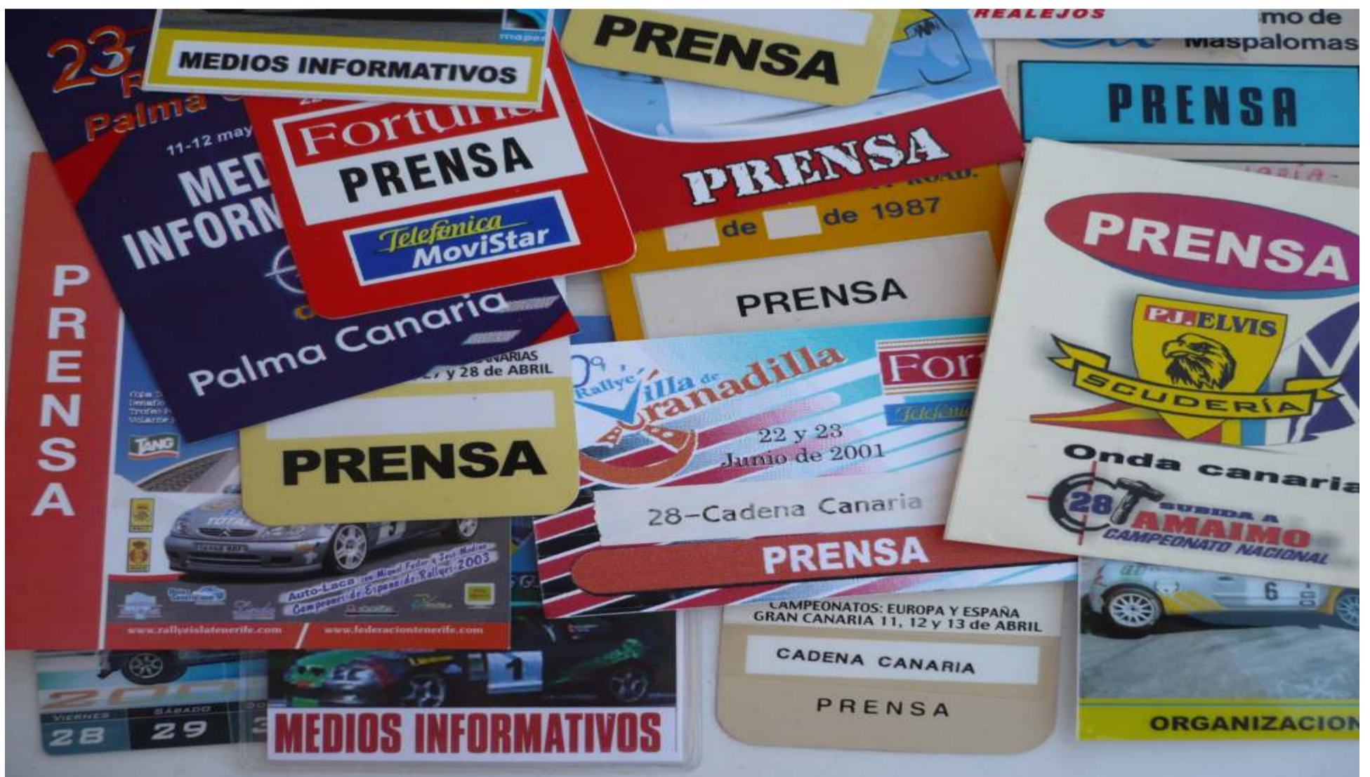
Las acreditaciones no siempre cumplen con el objetivo para las que, en principio, han sido concebidas

Texto: Sergio de Mesas