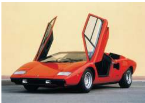
Lamborghini Countach LP 400

Los inspirados ingenieros de Lamborghini, Stanzani y Gandini, desarrollaron en 1971 un vehículo muy especial: el Countach 500, un prototipo inspirado en los coches de competición. Este vehículo, presentado en el Salón del Automóvil de Ginebra, estaba destinado a satisfacer a todos los aficionados del motor que disfrutaban con una conducción de alta velocidad. El LP 500 (prácticamente un único volumen de aluminio en forma de cuña aerodinámica y una enorme estabilidad en ca-