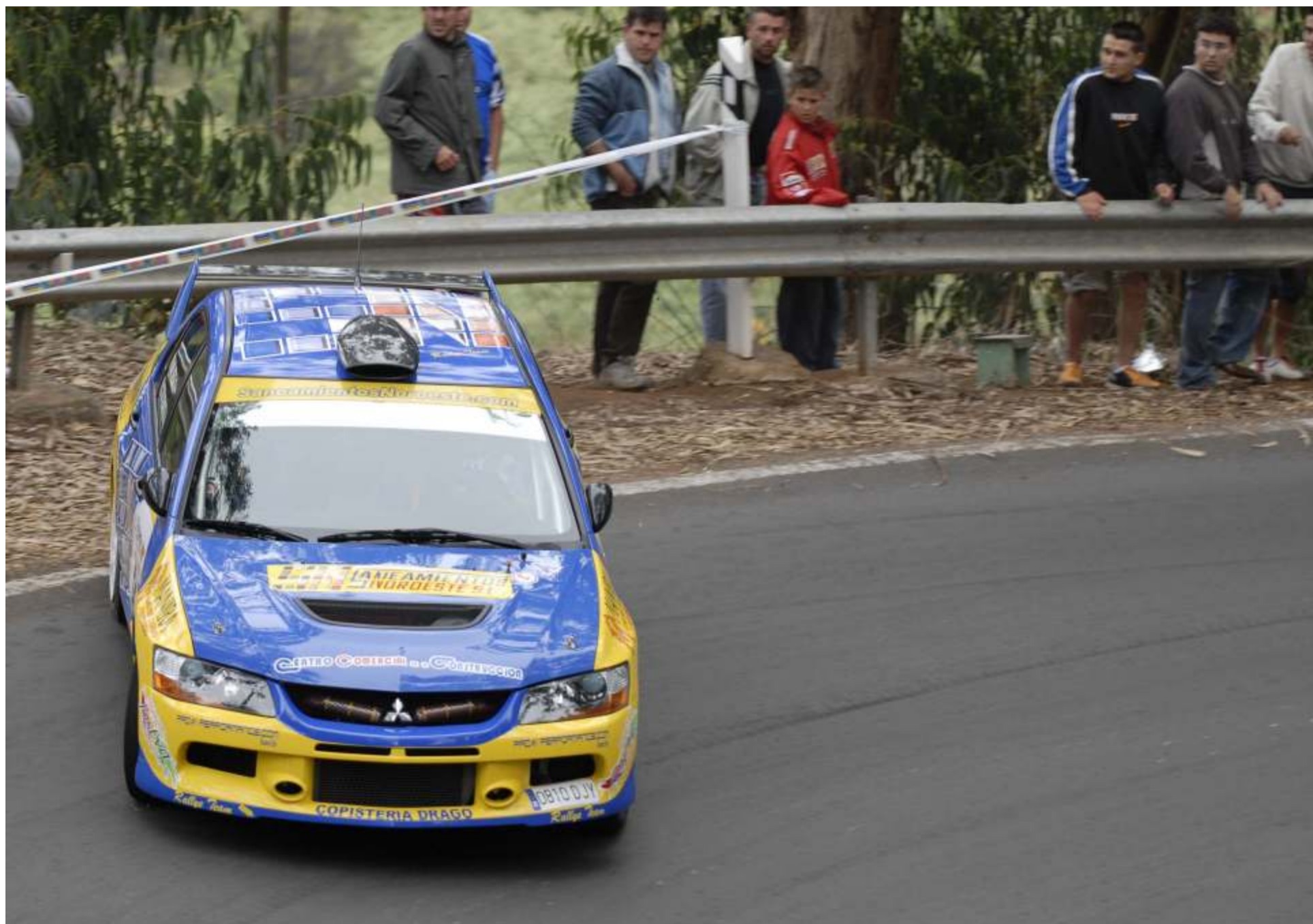
En el intermedio de la temporada Víctor Mendoza es segundo en la provisional del regional de montaña y líder en grupo N