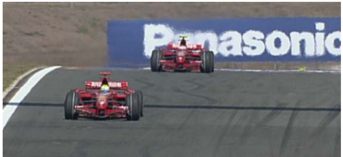
Los Ferrari fueron imbatibles en Turquía. El finlandés se tuvo que conformar con la segunda plaza